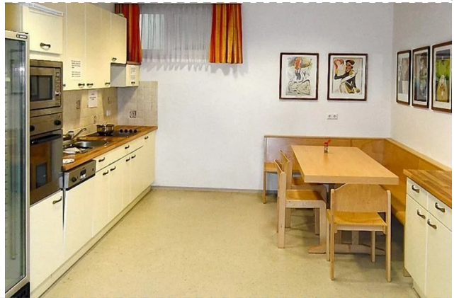
kuirejo je servo de loĝantoj