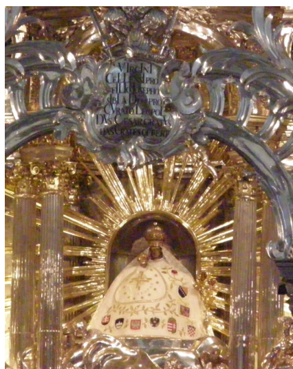
Bazililiko en Mariazell