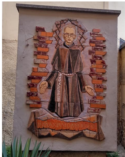
Franciskana preĝejo Maria La Helpantino