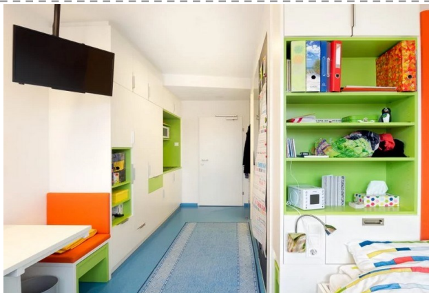
1-lita apartamento kun propra banejo/necesejo kaj kuirangulo