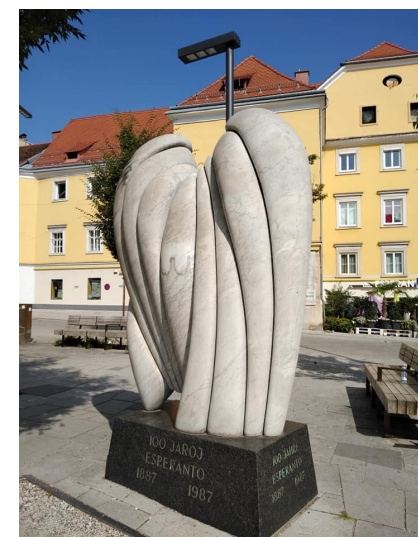
ZEO en Graz