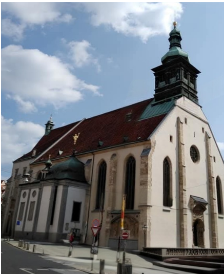
Katedralo de Graz

Ĉiuj programeroj kiuj okazos en la kongresejo aŭ dum la pilgrimoj en la preĝejoj estos hibridaj kaj oni povos sekvi ilin per ZOOM.