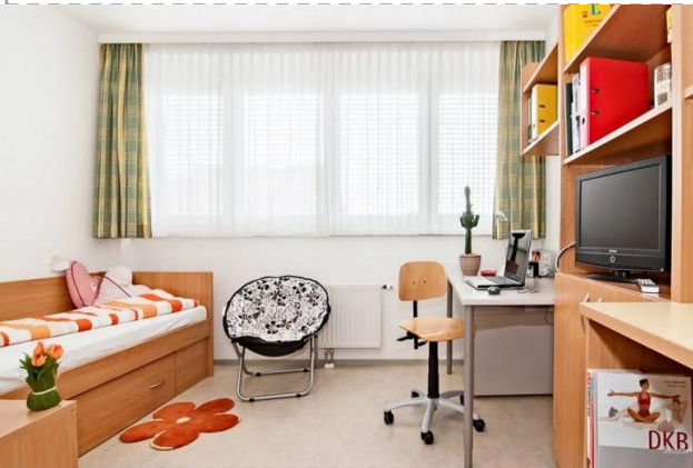
1-lita ĉambro kun propra banejo kaj necesejo

komunaj banejoj kaj necesejoj ekster la ĉambro