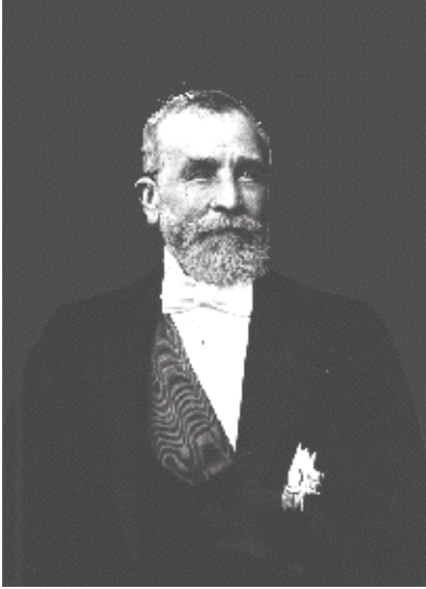
Émile-François Loubet, prezidanto de la franca respubliko de 1899 ĝis 1906.

la vizito al la itala Reĝo fare de la franca prezidanto Émile-François Loubet (1838-1929), vizito okazinta en 1904, la 9an de decembro 1905 la franca parlamento aprobis la leĝon por la disiĝo inter Ŝtato kaj Eklezio. La respondo de Pio la 10a ne atendigis sin, kaj ĝi konkretiĝis per du enciklikoj kontraŭ la franca regantaro: en encikliko Vehementer (Impete, 11an de februaro 1906) li kondamnis la disiĝon de la Eklezio disde la Ŝtato en Francio, kaj en Gravissimo officii munere (Pro gravega ofica devo, 10an de aŭgusto 1906) li kondamnis la leĝojn pri kultado proponitajn de la franca regantaro.