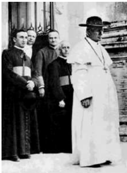
Pio la 10a kun kelkaj kurianoj.

En la internacia politiko estis intertempe eksplodinta la franca problemoj: post la eventoj kunligitaj kun la “maljustegaj leĝoj”, aprobitaj en Francio kontraŭ la Eklezio inter 1880 kaj 1903, kaj post la diskutadoj kiujn estigis