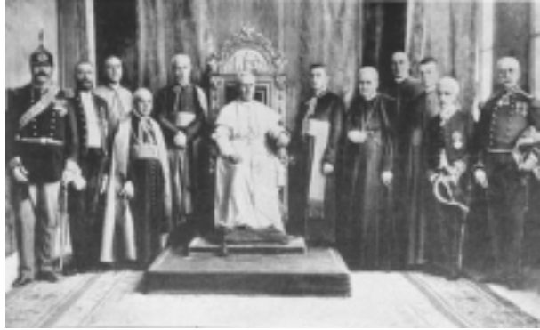
Kun la roma Kurio

unuiĝo de la orientaj Eklezioj kaj laste, du jaroj post la antaŭa, la apostola letero Ex quo nono (Post la tagoj en kiuj, 26an de decembro 1910) al la episkopoj de oriento pri la unuiĝo de la Eklezioj, kiu substrekas unu el la plej interesaj ekumenaj aspektoj de la papado de Pio la 10a.