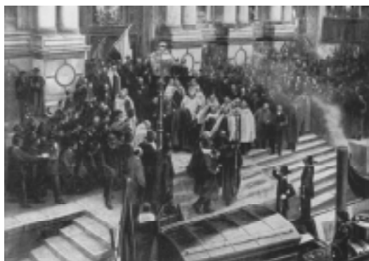
Solena eniro de patriarko Sarto en Venecion (24.11.1894)

rilate al la “spirito de kompato, ardo de karitato, la religia scienco kaj serioza sinpretiĝo”.