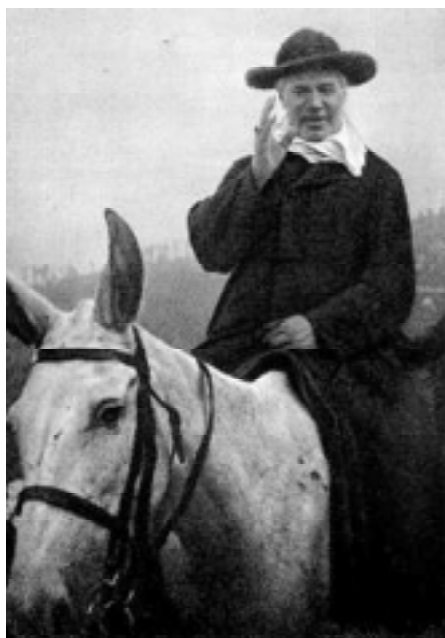
4an de aŭgusto 1904, kardinalo Sarto suriras monton Grappa por beni la kapeleton kaj la statuon de la Dipatrino.

Koncerne la socialan problemaron li invitis la personojn rigardi al Kristo-laboristo kaj aktivi por trovi, dum malkonsento, akordon inter salajratoj kaj labordonantoj. Pli ol grandaj brilaj ideoj aŭ teoriumadoj (laŭ la pensmaniero de Leono la 13a, ĝuste por klarigi), li pledis por la praktikaj intervenoj, bone pristuditaj kaj “alcelitaj”, kiuj povu teni je distanco la socialismajn ideojn: li donis tial impulson al la lernejo, kie oni instruis la faman brodaĵon punto di Burano (t.e. farata la en venecia insulo kiu famiĝis pro tiu ĉi teksil-arto) kaj kiu laborigis 400 junulinojn, kontribuante al emancipiĝo de la virinoj; li viglis kontraŭ uzurado por la starigo de la parokaj laboristaj kaso, la kamparaj ŝparkaso kaj la Banko de Sankta Marko; li akcelis la Societojn de Reciproka Helpe (asekuroj kontraŭ la malsanoj), kuraĝigis la sekretariaton de la popolo por la asistado al