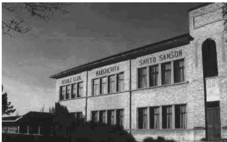
La elementa lernejo en Riese dediĉita al la patrino de la estonta Papo Pio