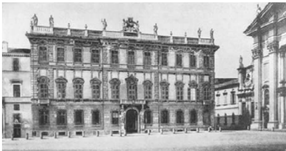
La Episkopejo de Mantova