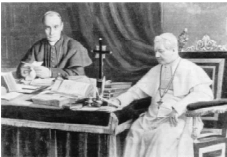
Papo Pio la 10a kun sia ŝtatsekretario, kardinalo Merry del Val.

Ne mankis tamen liaj intervenoj el originala reforma graveco kaj el universala spiro: kiel la apostola deklaro Sapienti consilio (Pro sciplena konsilo, 29an de junio 1908) pri la reformo de la roma kurio, la letero Quidquid consilii (Io de la konsilo, 8an de julio 1908) pri la