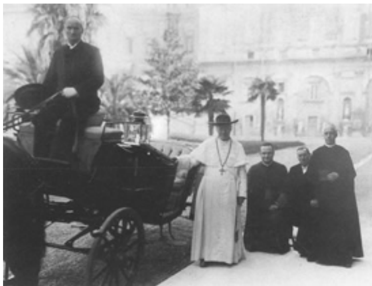
Pio la 10a en la vaticanaj ĝardenoj.

Sekvis poste la encikliko Ad diem illum (En tiu ĝojega tago, 2an de februaro 1904) okaze de la kvindeka datreveno de la difino de la dogmo pri la Senmakula Koncipiĝo de Maria, la letero Quum arcano (Kiam pro mistera plano, 11an de februaro 1904) per kiu li anoncis la apostolan viziton al urbo Romo 30 , sekvata, post nelonge, de la dekreto Constat apud omnes (Rezultas ĉe ĉiuj, 7an de marto 1904), per kiu li prenis samspecan inicia-