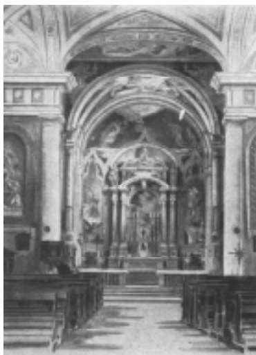
Interno de la preĝejo en Salzano

Kiel multaj venetiaj parokestroj de la 19a jarcento, li ricevis la respondecon direkti la komunumajn lernejojn: li estis fakte elektita direktoro en 1868 kaj poste vokto en 1869; interalie, dum lia paroka prizorgado, estis malfermita la porvirina sekcio de la komunumaj lernejoj, ĉar antaŭe, kiam tie estis