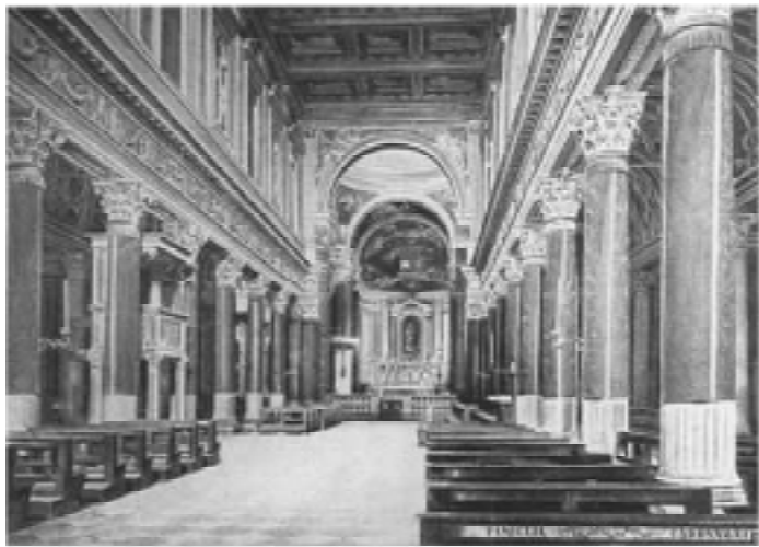
Interno de la Katedralo de Mantova.

Multon oni skribis pri ĉi tiu decido, sed jen lia koncerna penso: “La rekomendenda temo estas la Gregoria Ĉanto, kaj speciale la maniero kanti ĝin, kaj igi ĝin popola. Ho! Se oni