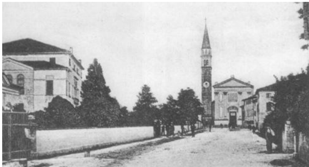
Panoramo de Riese

Giuseppe Melchiorre Sarto, la estonta Pio la 10a, naskiĝis la 2an de junio 1835, kaj la postan tagon, la 3an de junio 1835, baptis lin la kapelana