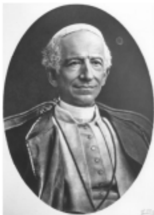
Papo Leo la 13a