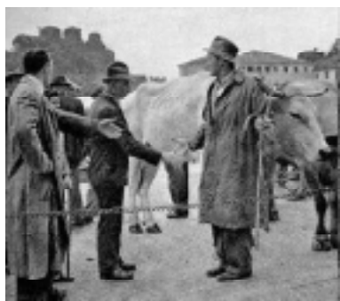
Maklerado de brutoj en la merkato.

(kiu tiam estis nur miksaĵo de juraj normoj akumuligintaj dum jarcentoj).