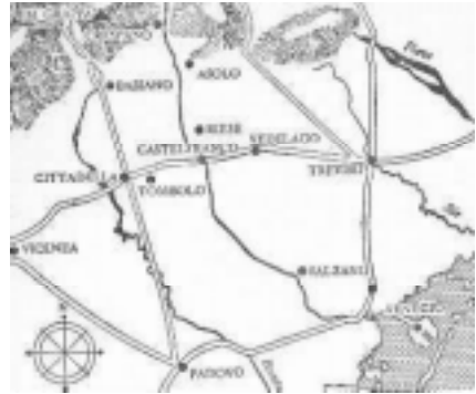
La lokoj de la juneco de Pio la deka.