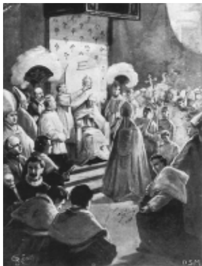
Desegno kiu bildigas la kronadon de Pio la 10a (9an de aŭgusto 1903)

apostolatus cathedra (El la plejsupera apostola katedro) datita la 4an de oktobro 1903, en kiu enestas ankaŭ la papa devizo Instaurare omnia in Christo (laŭvorte: sumigi ĉion en Kristo) 29 .