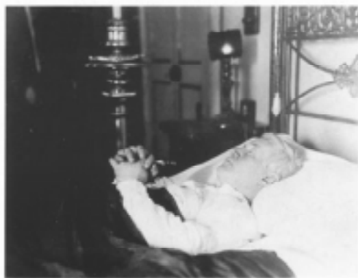
Sur la mortolito

Aliaj papaj agoj de Pio la 10a estis la apostola deklaro Divino afflatu (Pro Dia inspiro, unuan de novembro 1911), kiu reformis la roman brevieron; la apostola deklaro Etsi nos (Kvankam Ni, unuan de januaro 1912), kiu antaŭvidis la reformon de la vikariejo de Romo; la encikliko Lacrimabili statu (Pro priplorinda stato, 7an de junio 1912) pri la malhumanaj kondiĉoj en kiuj devis