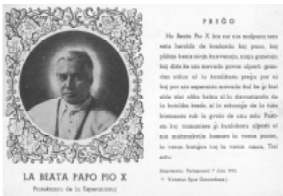
Unu el la religiaj bildetoj eldonitaj en Esperanto honore al Pio la 10a

proceso kiu kondukis al la sanktproklamo de Pio la 10a: li evidentigas liajn limojn el historia kaj metodologia vidpunkto, sed li praktike starigas la personon en lia tempo kaj relokas lin en la jaroj dum kiuj li agadis, male ol tio, kion faris sufiĉe da sukereca hagiografio kiu, por edifi la legantojn, igis la sanktulon eltirita de lia epoko 45 .