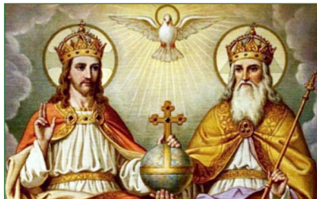
La Plejsankta Triunuo

Kornelio estis pagano kaj Petro la tutan vivon opiniis kiel grava peko estas komune manĝi ĉe la tablo kun pagano. La aferoj estis klare starigitaj, la muro inter ambaŭ personoj ŝajnis esti nedetruibla. Kaj poste sursceniĝis la Sankta Spirito. Li instigis Petron, ke li faru tion, kion li dum la tuta vivo opiniis kiel nepran pekon, do eniri en la domon de Kornelio kaj manĝi ĉe la tablo kun li. Kaj Kornelio superis defundamente