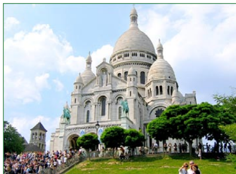
Sacre-Coeur en Parizo

mo, sed iutempe telefonis al mi kun deziroj por la Tago de Patrino. Post kelkaj jaroj ŝi surprizis min, kiam ŝi venis kaj eltiris el mansaketo... legitimilon de kristanino. Ŝi akceptis la bapton en sia paroĥo.