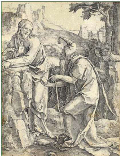
Kristo tentata de diablo Lucas van Leyden 1418

La Spirito pelis Jesuon for en la dezerton. Kaj Li estis en la dezerto kvardek tagojn, tentata de Satano; kaj Li estis kun la sovaĝaj bestoj, kaj la anĝeloj servis al Li. (Mar 1,12-13)