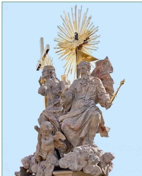
Kolono de la Plejsankta Triunuo en la urbo Kroměříž, Ĉeĥio

Kiam sankta Aŭgusteno pripensis la Plejsanktan Triunoon, irinte surborde de la maro li ekvidis knabon, kiel li transverŝas akvon en kaveton. „Kion vi faras?“ li demandis. „Mi transverŝas la maron!“ respondis la knabo. „Tio je ne eblas“, respondis Aŭgusteno kaj la knabo ekridete diris: „Mi pli facile transverŝos la maron en la kaveton, ol vi ekkomprenos misteron de la