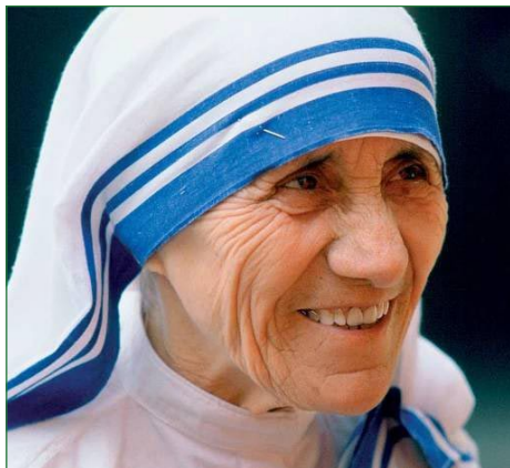
Ĉi tiun litanion verkis Patrino Tereza

Donu al ni, Sinjoro, ke ni timu Vian Sanktan nomon kaj samtempe ĝin amu, ĉar Vi neniam ĉesas gvidi tiujn, kiujn per Via amo Vi fortigas. Kiu vivas kaj regas eterne. Amen.